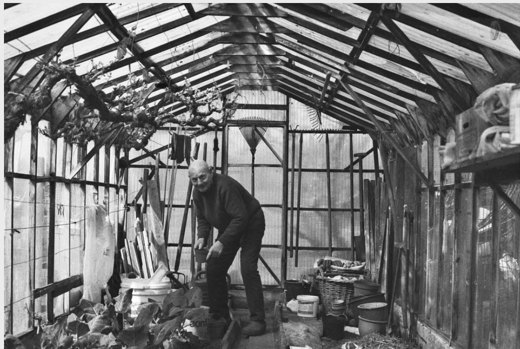
El invernadero, el reino de opa.