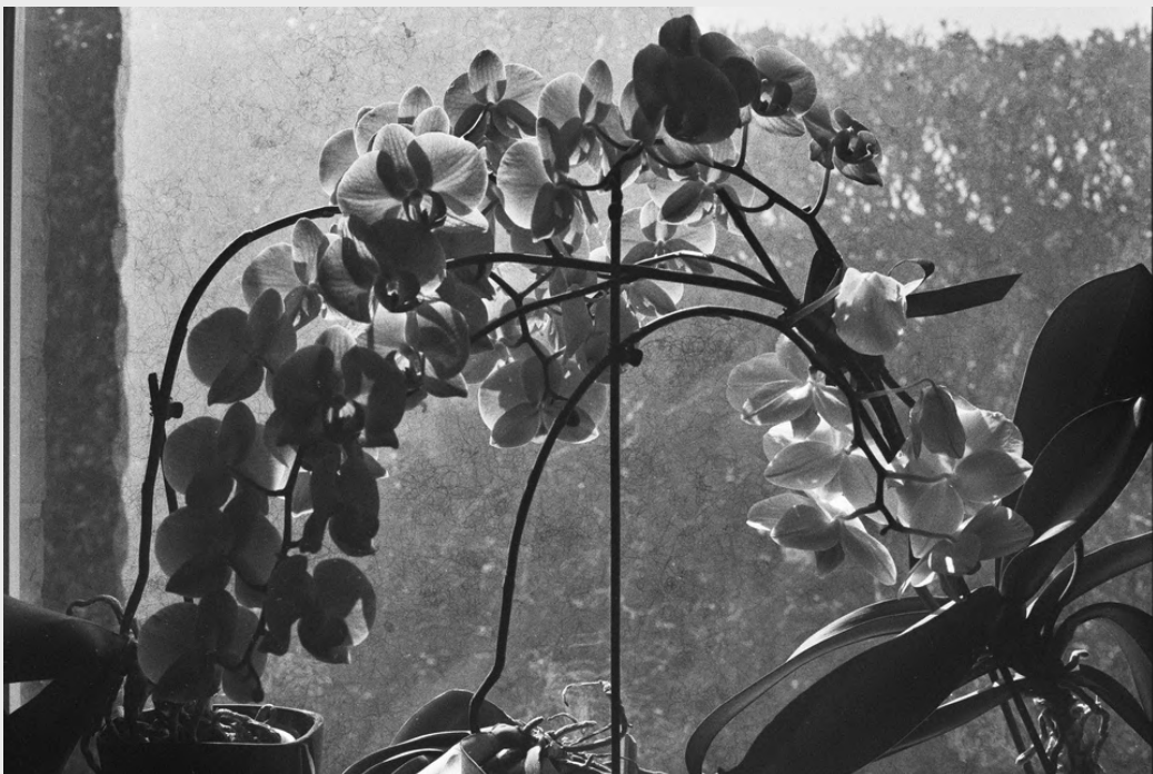
Las queridas orquídeas de oma.